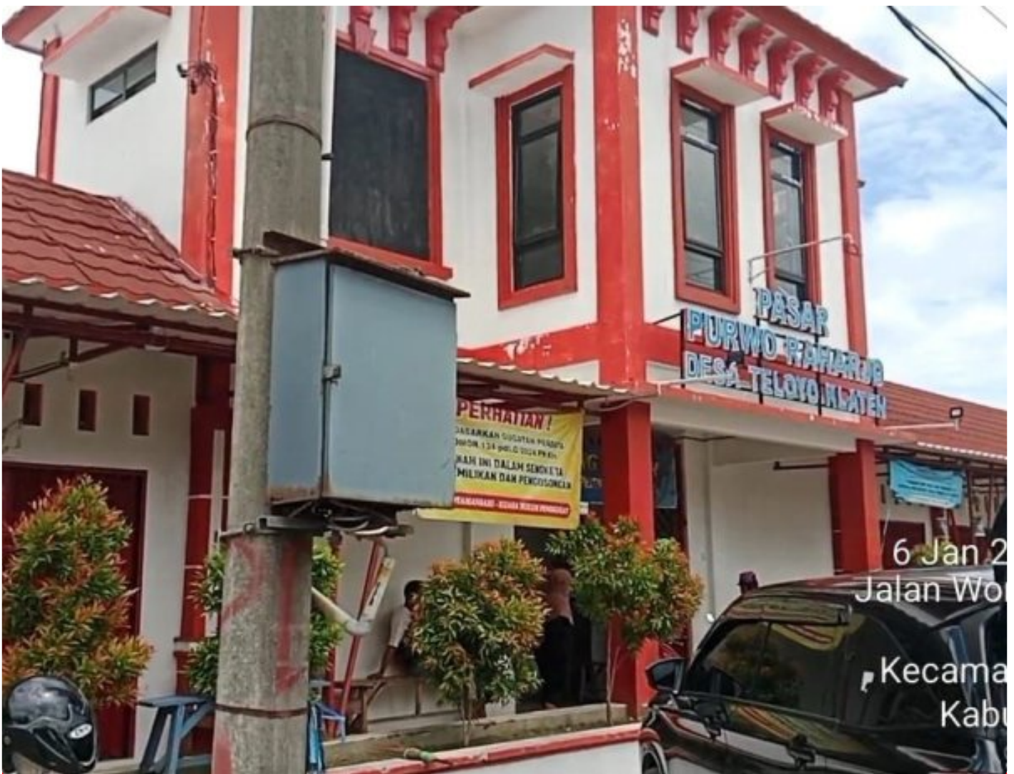
Foto: Pasar Purwo Raharjo di Desa Teloyo, Kecamatan Wonosari, Kabupaten Klaten, kembali memicu perhatian publik.